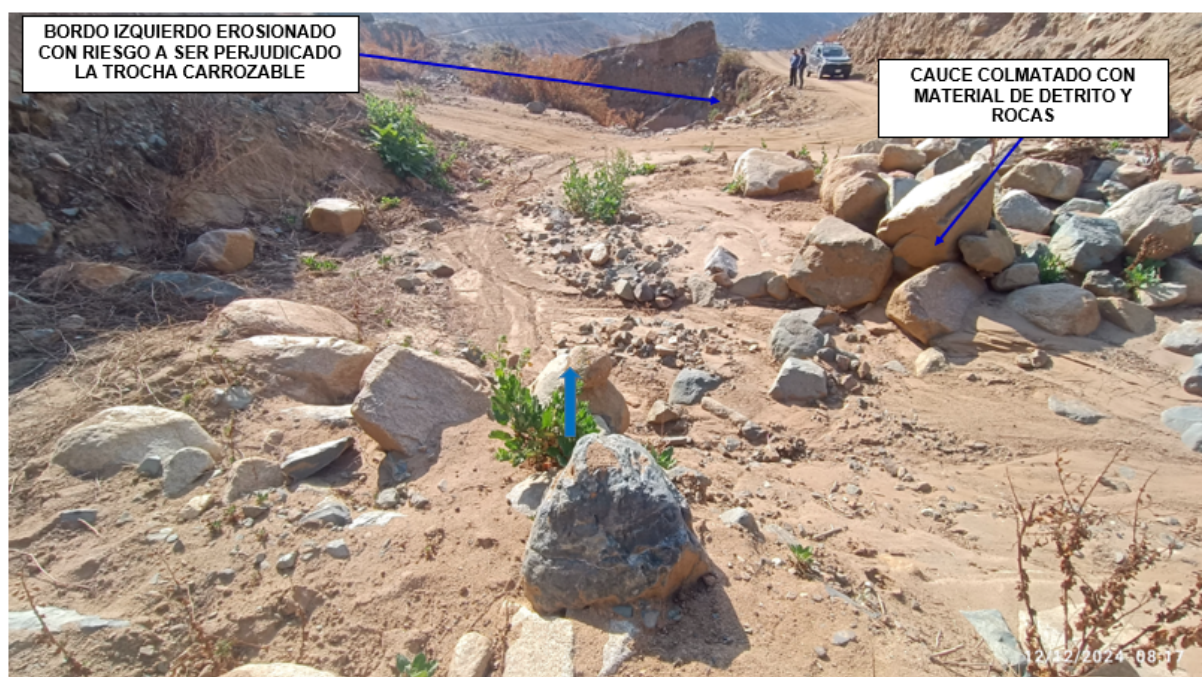
FIGURA N°04: CAUCE COLMATADO CON FLUJO DE DETRITOS, EN LA MARGEN DERECHA EL BORDO DERECHO SE ENCUENTRA EROSIONADO, CON RIESGO A SER SOCAVADO EN ÉPOCA DE AVENIDAS.