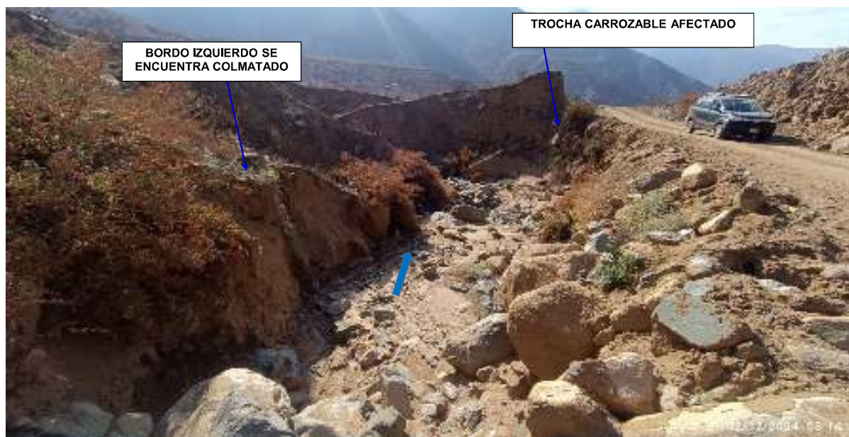
FIGURA N°02: TRAMO DE LA QUEBRADA SILLA SE ENCUENTRA COLMATADO Y A SU VEZ EROSIONADO LA MARGEN DERECHA DONDE ES NECESARIO LA DESCOLMATACIÓN Y CONFORMAR UN DIQUE EN LA MARGEN DERECHA CON MATERIAL PROPIO.