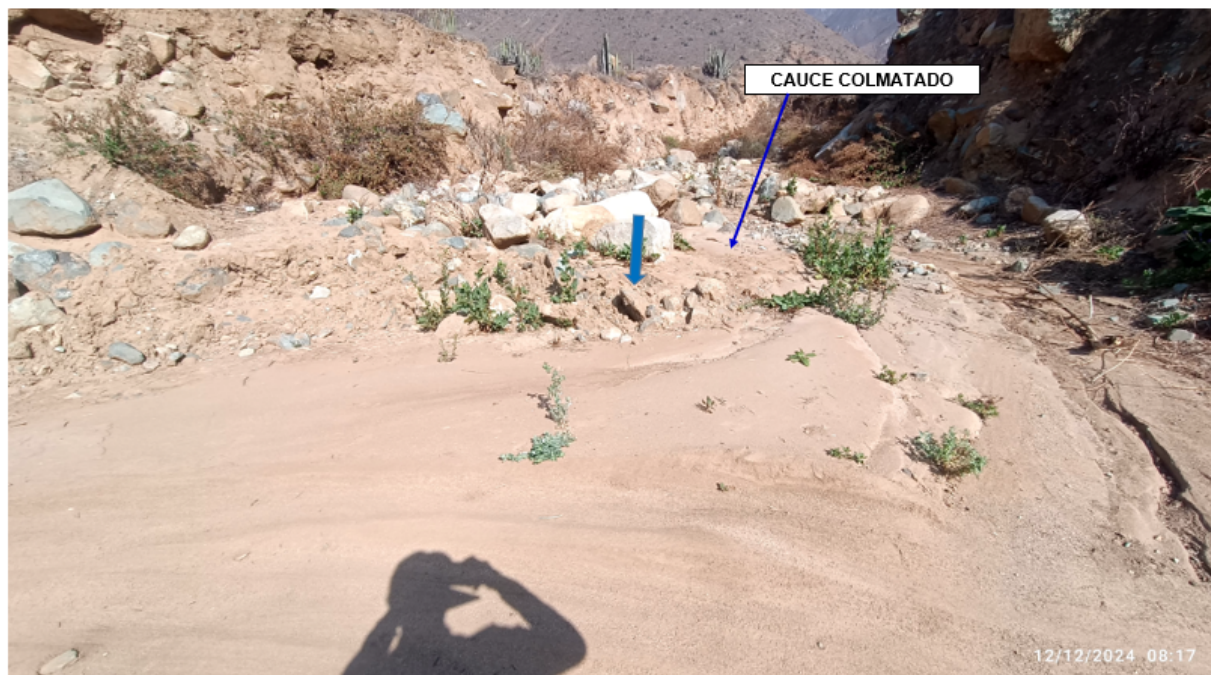
FIGURA N°01: UBICACION DE LA QUEBRADA SILLA QUE SE ENCUENTRA COLMATADO A LA ALTURA DEL SECTOR HUARANGUITO DE LA COMUNIDAD CAMPESINA Y DISTRITO DE SUMBILCA, PROVINCIA DE HUARAL - LIMA.