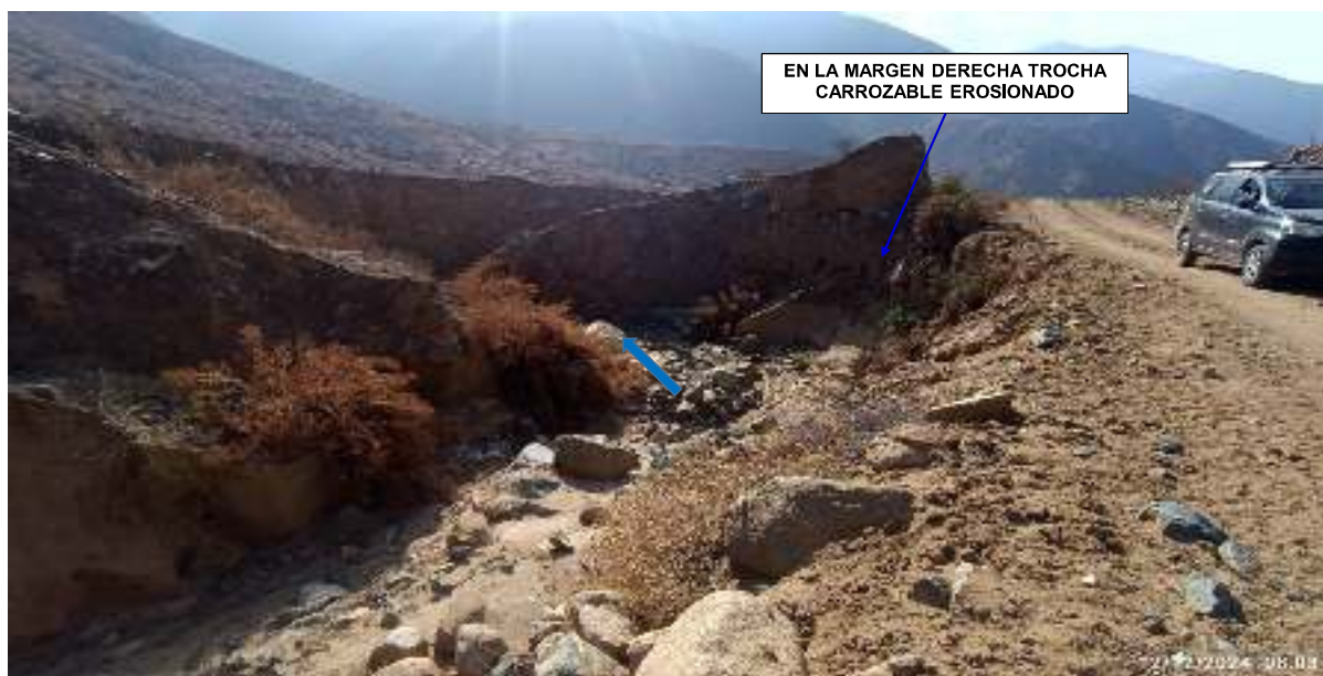
FIGURA N°03: QUEBRADA SILLA SE ENCUENTRA COLMATADO, QUE REQUIERE LIMPIEZA, DESCOLMATACIÓN Y CONFORMAR UN DIQUE A LA MARGEN DERECHA DEL TRAMO.